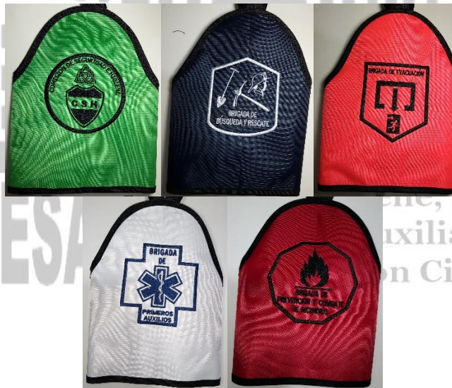
SIN CINTA REFLEJANTE

El logotipo puede ser de su empresa o el que tenemos diseñado para cada brigada (pregunte por ellos)