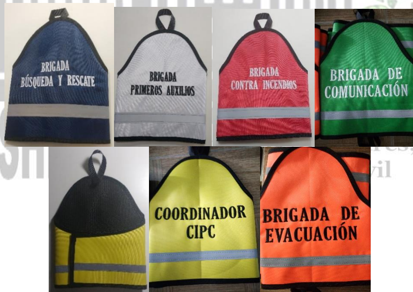
CON CINTA REFLEJANTE

El texto puede ser el nombre de cada brigada o el texto deseado, El TAMAÑO de la LETRA se adapta al espacio disponible