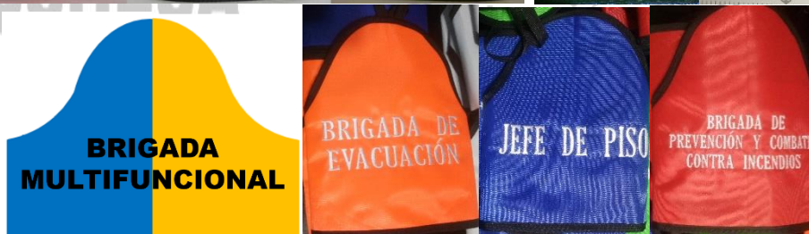
SIN CINTA REFLEJANTE

"Ayudamos a Prevenir Accidentes y Enfermedades de Trabajo"