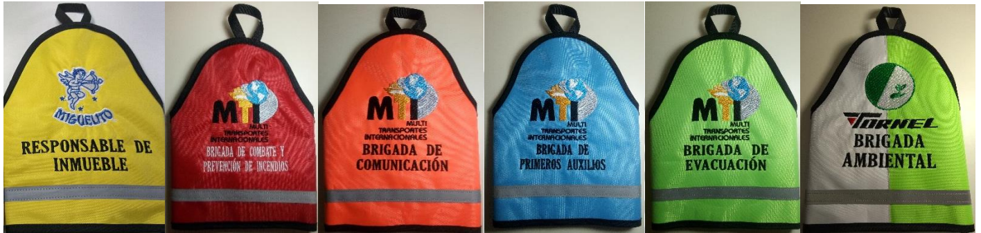
CON CINTA REFLEJANTE