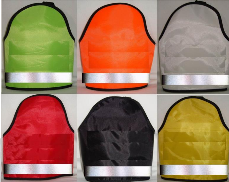
CON CINTA REFLEJANTE