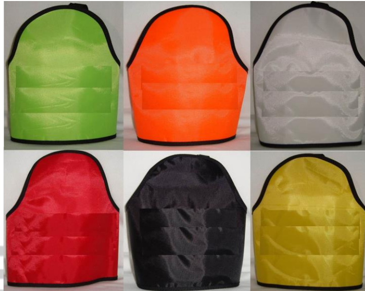
SIN CINTA REFLEJANTE