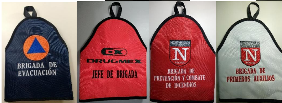
SIN CINTA REFLEJANTE