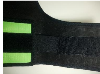
DETALLE DE PARTE TRASERA DEL BRAZALETE