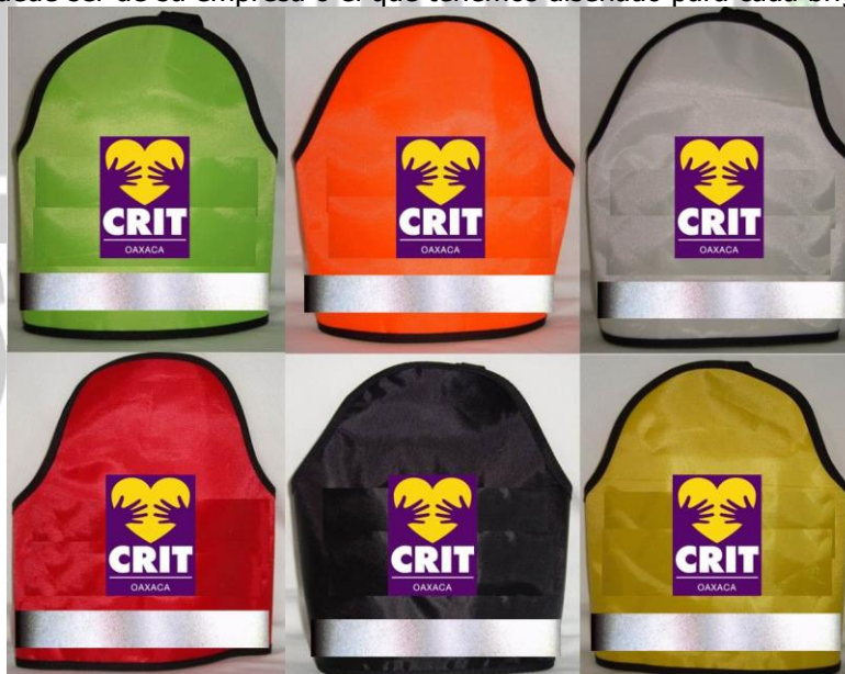
CON CINTA REFLEJANTE

El LOGOTIPO puede ser de su empresa o el que tenemos diseñado para cada brigada (pregunte por ellos)